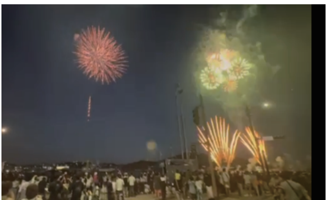
くきのうみ花火の祭典(7月20日)